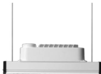
50 W, 100 W, 150 W, 180 W